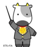
証券知識普及プロジェクト マスコットキャラクター